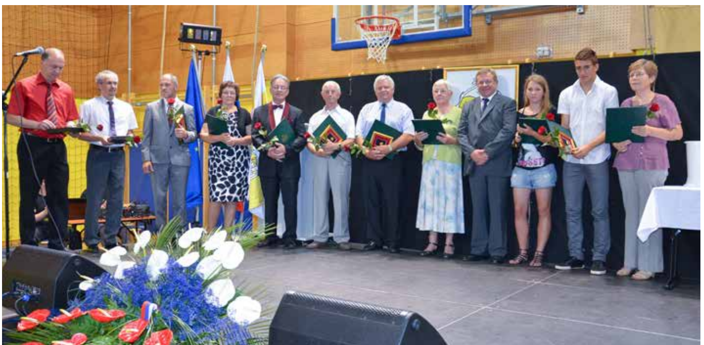
Dobitniki občinskih priznanj in zlatih grbov Občine Pesnica za leto 2012

Za prispevek Okteta Pesnica k bogati kulturni dejavnosti v kraju in občini se mu izroči priznanje Občine Pesnica.