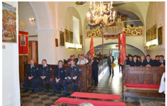
Cerkev sv. Jakoba v Jakobskem Dolu