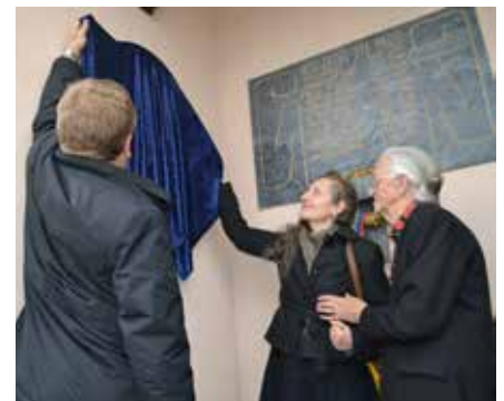
Odkritje spominske plošče