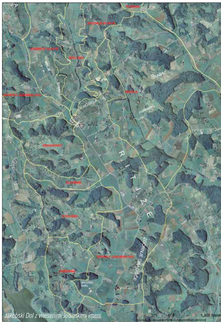
Jakobski Dol z vnesenimi ledinskimi imeni

Upava, da bova s tem prispevkom pripomogla k ohranitvi naših ledinskih imen.