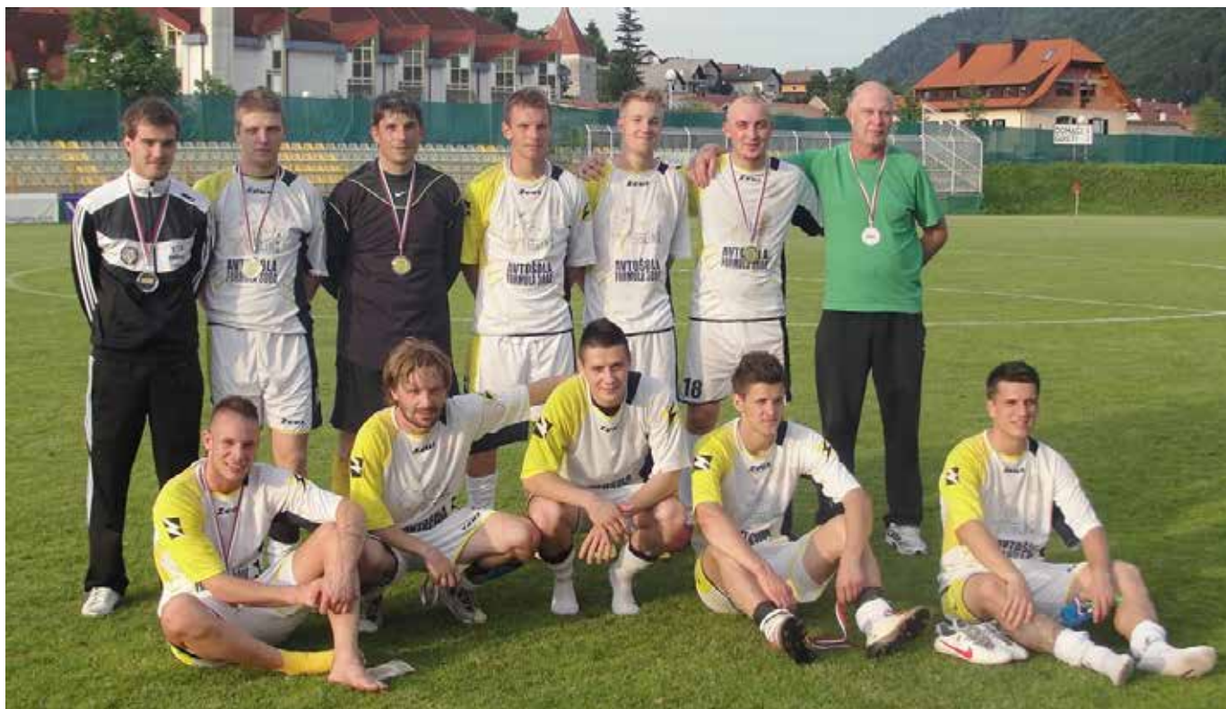
Osvojitev drugega mesta v pokalnem tekmovanju – Dravograd, 9. junija 2012

V imenu uprave se zahvaljujem vsem staršem, ki pomagajo klubu, vsem sponzorjem, donatorjem in drugim, ki kakorkoli pomagajo NK Pesnica, ter seveda Občini Pesnica, brez pomoči katere ne bi mogli tako uspešno delovati.