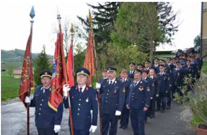
Povorka članov PGD občine Pesnica

Po maši so organizatorji pripravili tradicionalno in prijetno druženje gasilcev in gostiteljev v župnijski dvorani v Jakobskem Dolu.