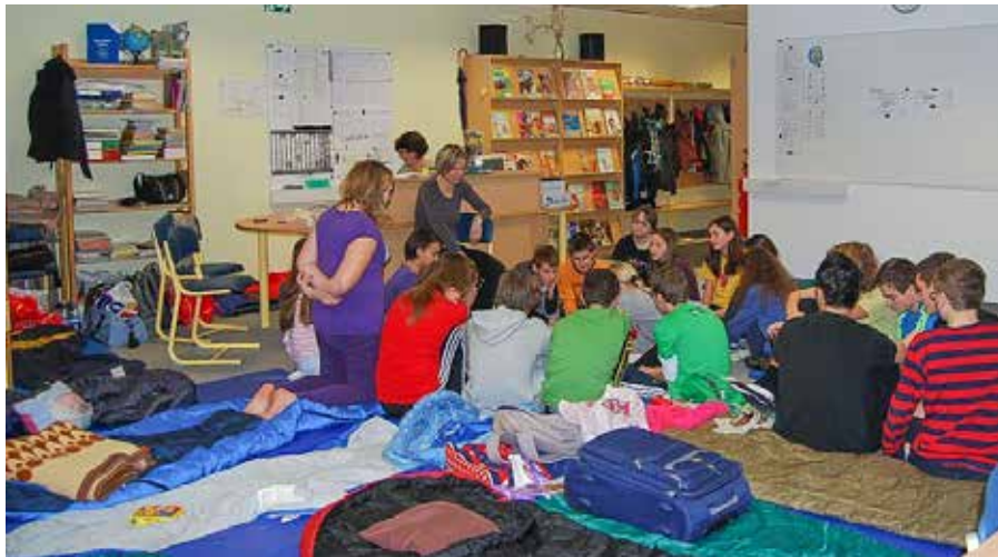
Večerno druženje pred spanjem ob družabni igri

Učenci so tako več brali in bili po branju aktivni: o prebranem so poustvarjali in kritično razmišljali ter ob učiteljevem vodenju svoje izdelke objavili na internetu v spletni aplikaciji SIMOS.