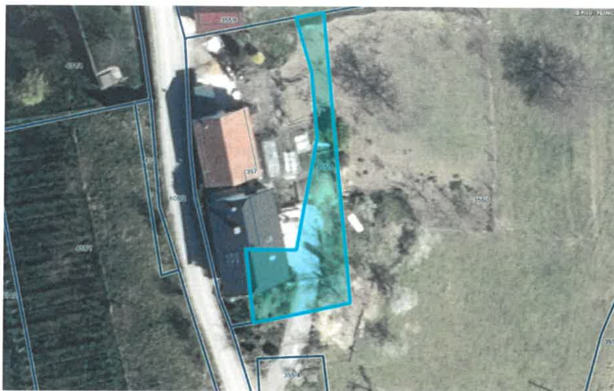
Priloga 1: Skica nepremičnine katastrska občina 606 Ranca parcela 355/5 (iz sistema PISO)